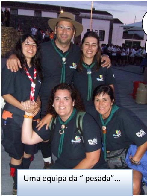
Uma equipa da "pesada"...